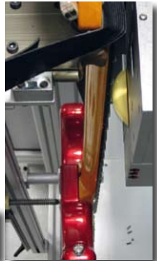
Egal ob Neusilber oder Stainless Steel: Das plek Fräsmodule bearbeitet die Bünde mit einer Genauigkeit von 1/100 mm.

Abschließend werden die Bünde poliert und die Intonation wird eingestellt.